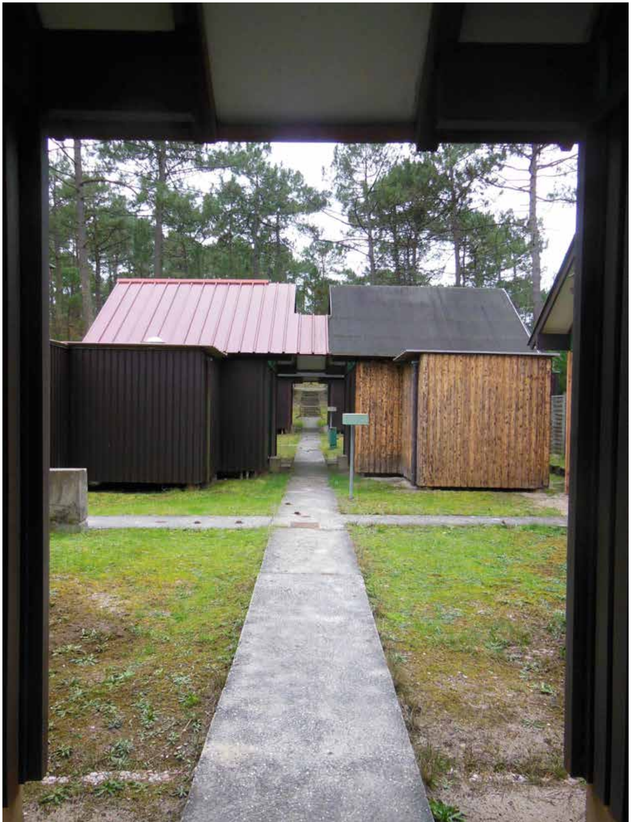
Village de vacances Sylvadour : ville miniature dans grand paysage