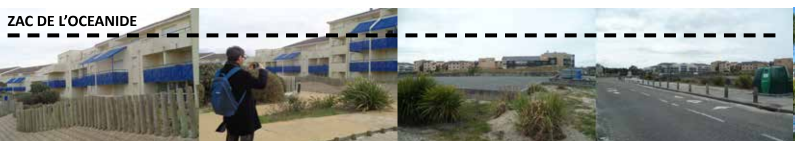
PLAN PAYSAGE / séminaire itinérant d'exploration des paysages produits par les plans nationaux d'aménagement du territoire