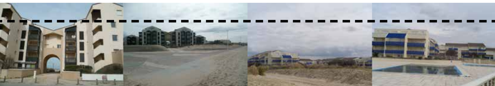
PLAN PAYSAGE / séminaire itinérant d'exploration des paysages produits par les plans nationaux d'aménagement du territoire