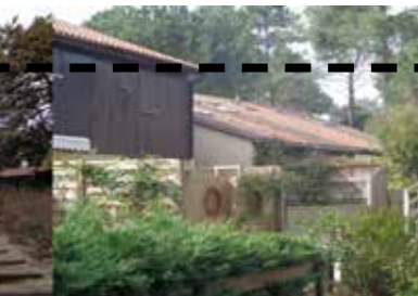
ZAC DE L'ARDILOUZE