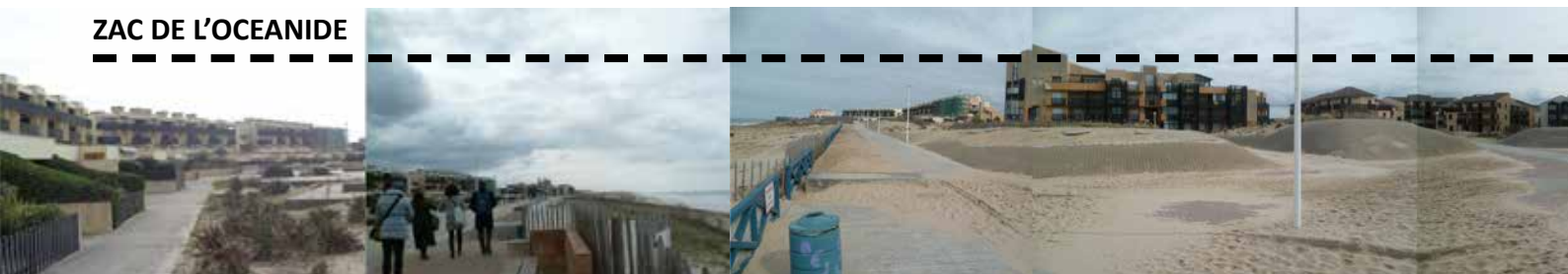
PLAN PAYSAGE / séminaire itinérant d'exploration des paysages produits par les plans nationaux d'aménagement du territoire